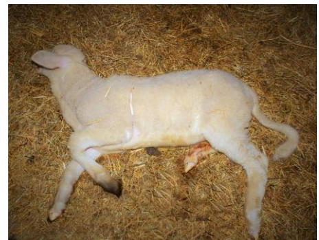
Bild 1: Enterotoxämie bei einem Lamm → plötzlicher Tod gut entwickelter Tiere