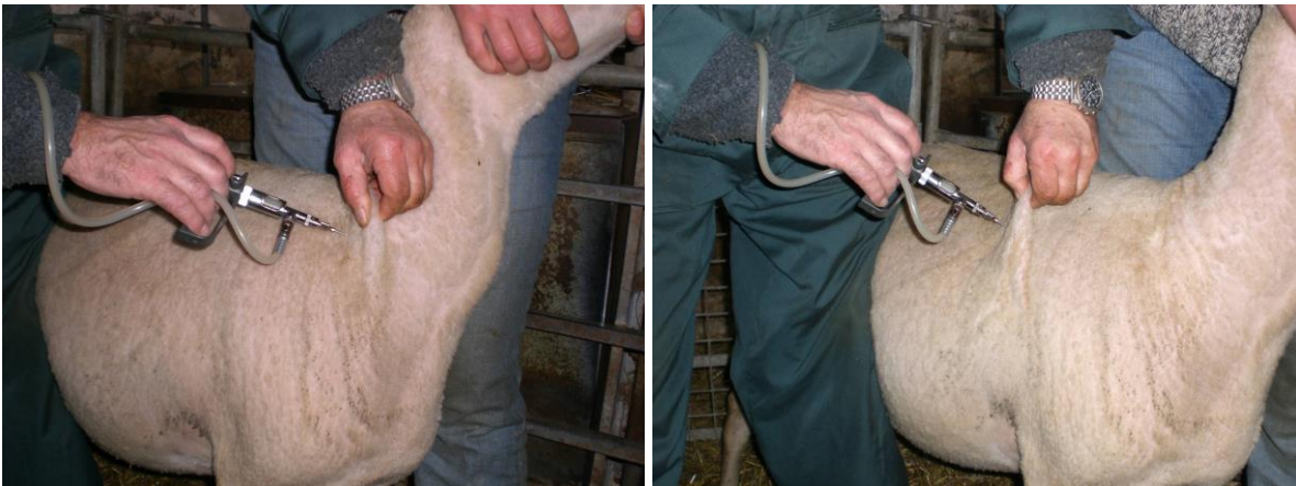
Bild 4: sinnvolle Applikationsorte beim Schaf; genauso für die Ziege möglich

Bei der Entnahme ist zu beachten, dass eine sterile Kanüle in der Impfstoffflasche verbleibt um Kontaminationen zu vermeiden. Die Weiterverwendung angebrochener Flaschen ist mit Risiken behaftet. Neben möglichen Kontaminationen kann ein vergrößerter Luftraum zu Oxidationsschäden des Antigens oder Trägerstoffs führen. Auch Temperaturschwankungen können Beeinträchtigungen hervorrufen.